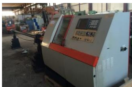
CNC Drehmaschine EMCO Turn 325 mit Stangenlader EURO 17.999,-