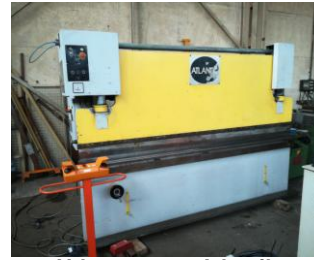
Abkantpresse Atlantik 3,0 m x 100 to EURO 14.990,-