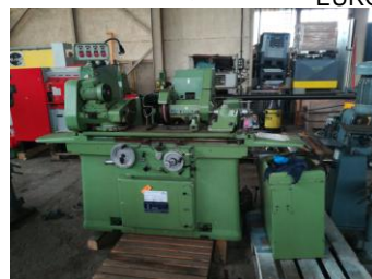
Rundschleifmaschine JONES&SHIPMAN EURO 6.000,-