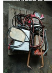
Mobile Punkt- schweißzange EURO 2.500,-