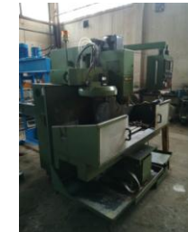
Bearbeitungszentren - VMC-60 A EURO 7.990,-