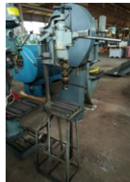
Bohrmaschine mit Ständer EURO 150,-