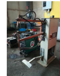
Punktschweiß- maschine Tecna EURO 2600,-