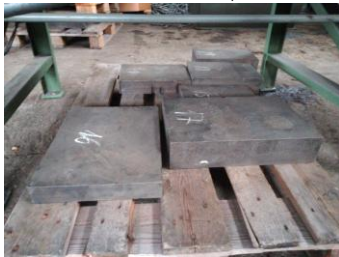
Anreißplatten je nach Größe ca. 20 Stk. ab EURO 150,-