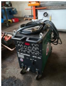
Schweißgerät MTE Migatronic 150 WIG EURO 2.300,-