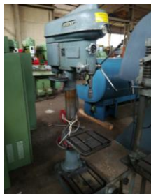
Ständerbohrmaschine Flott, schwere Ausführung EURO 2.100,-