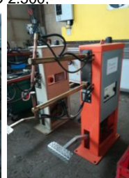
Punktschweiß- maschine Tecna EURO 2.100,-