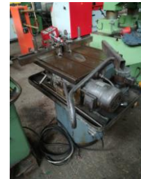
Kreissäge ULMA EURO 1.500,-