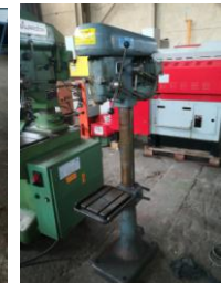
Ständerbohr- maschine EURO 850,-