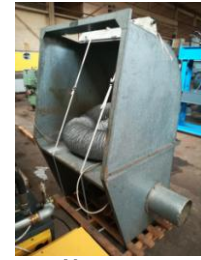
Absaugung EURO 1.700,-