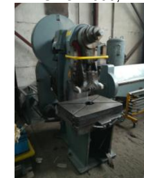
Exzenterpresse EBU 75 to Drehkeil EURO 3.900,-