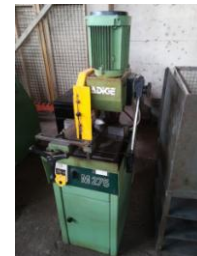
Kreissäge ADIGE M 275 mit Rollbahn und Anschlag Euro 2.600,-