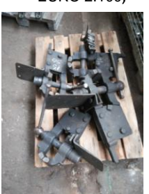
Steirische Schraubstöcke ab EURO 150,- je nach Größe ( 20 Stk.)