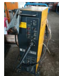
Schweißgerät Kjellberg GIV 201 EURO 2850,-