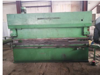
Abkantpresse Schmelzer 3,5 m x 125 to EURO 9.999,-