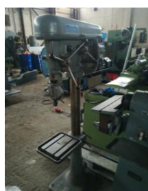
Ständerbohrmaschine mit Wechselbohrfuttersyst. EURO 1.100,-