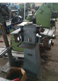
Werkzeugschleif- maschine EURO 2.350,-