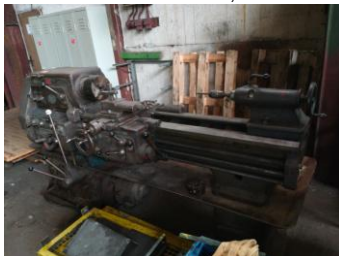
Drehmaschine 1 m EURO 999,-