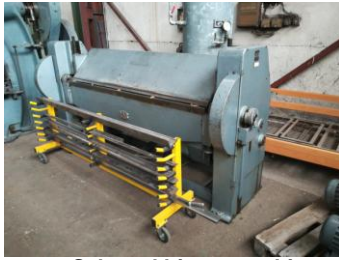
mot. Schwenkbiegemaschine RAS 2040 m x 3,5 mm EURO 15.500,-