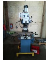
Bohr-Fräsmaschine EURO 2.700,-