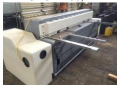
Mot. Tafelschere HESSE KS 254 2550x4 mm EURO 7.500,-